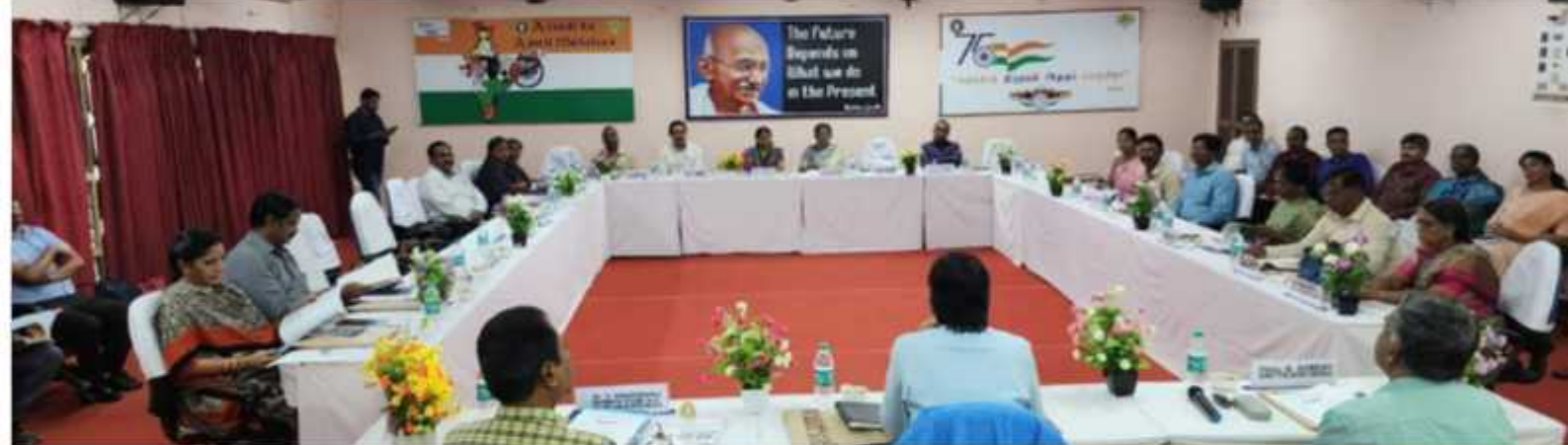
Programme Advisory Committee meeting held on 19.06.2023 at Chennai